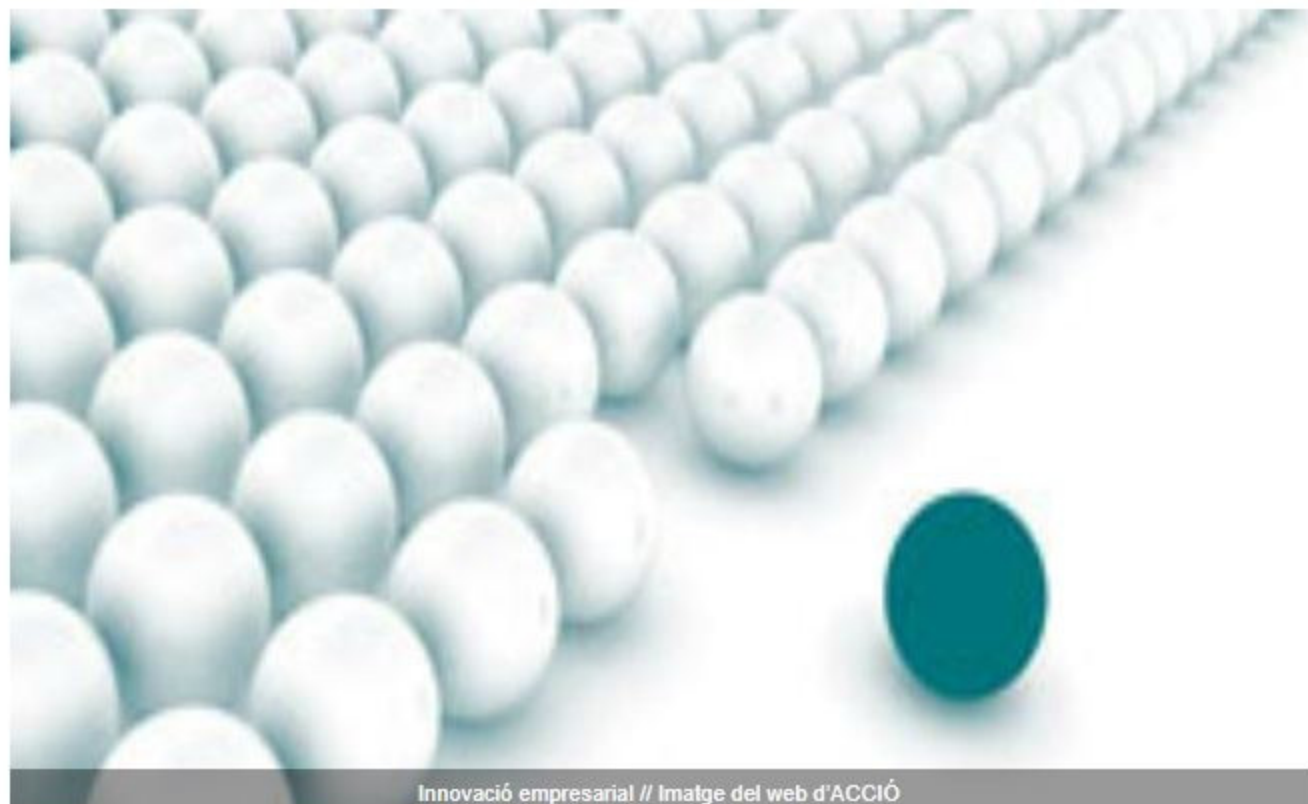
Innovació empresarial

La Generalitat de Catalunya, a través d'ACCIÓ ha organitzat aquesta setmana que avui acaba, una missió estratègica de 22 clústers catalans a Singapur. La missió, emmarcada en el programa Catalunya Clústers d'ACCIÓ, ha estat la que ha comptat amb més clústers des que va néixer aquesta iniciativa.